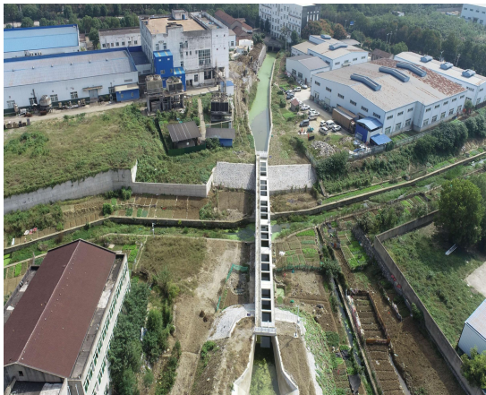
小张湾渡槽及 K14+400 北干渠 (2025.11.10)