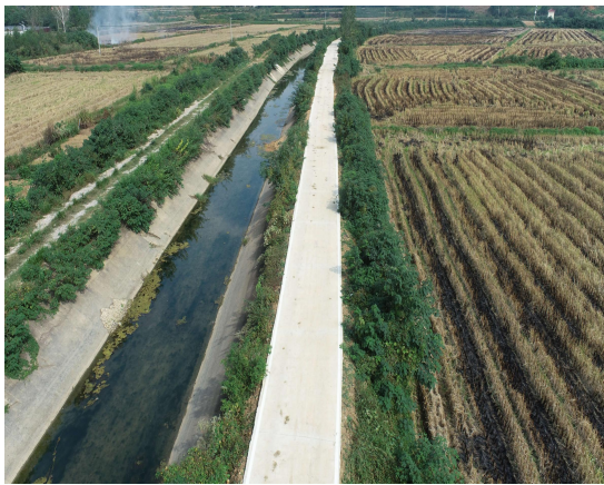
K34+100 北干渠及渠顶路 (2025.11.10)