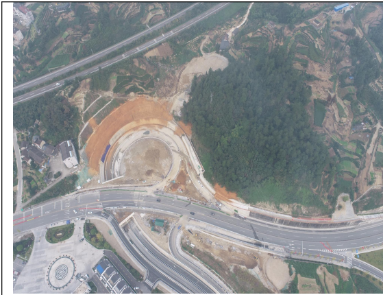
二圣路、楚天路互通 2023 年 3 季度