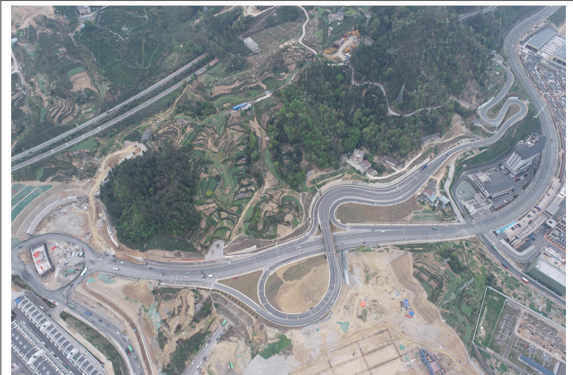
工程形象进度（2023年1季度）