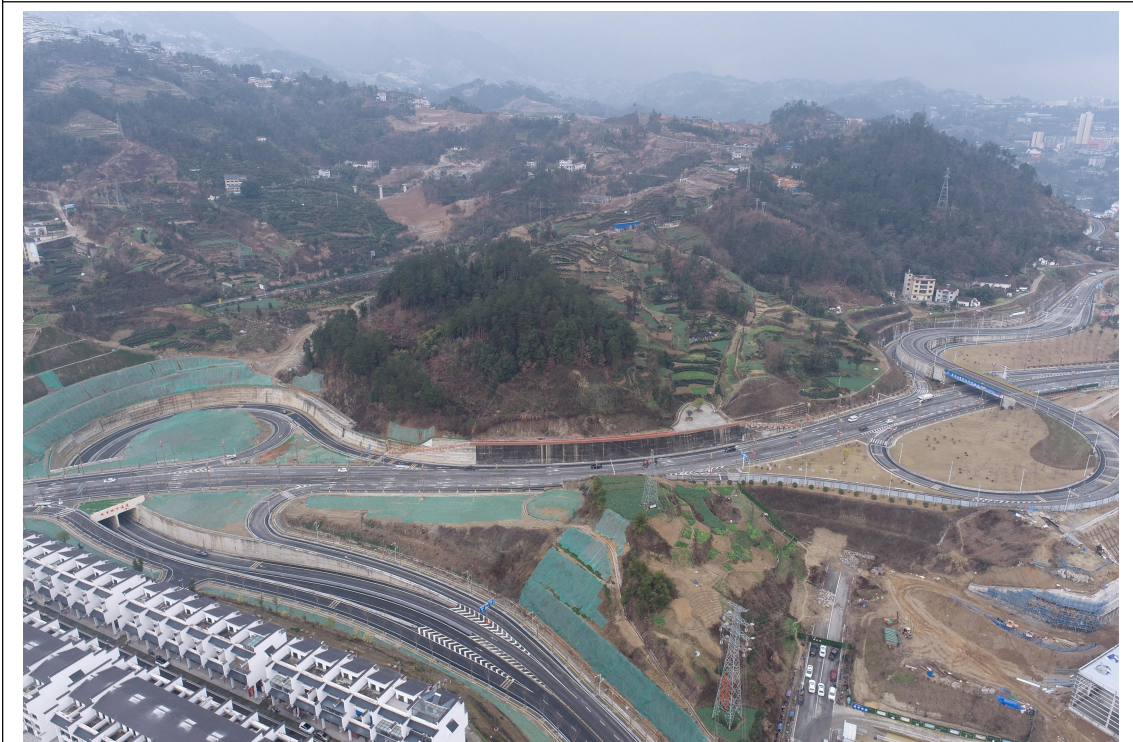
工程形象进度（2023年4季度）