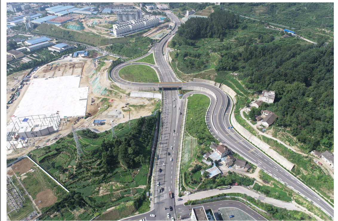
工程形象进度（2023年2季度）