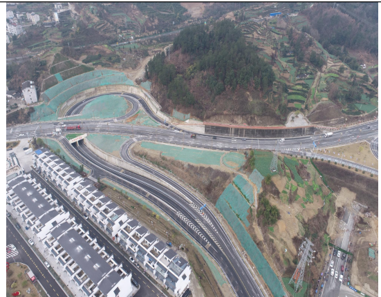
二圣路、楚天路互通 2023 年 4 季度