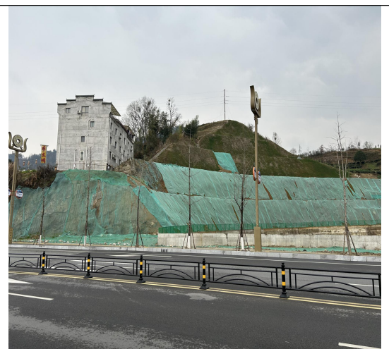
临时苫盖 (2023 年 4 季度)