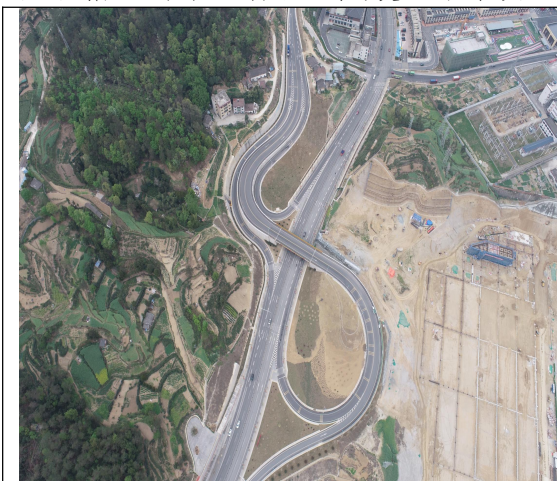
芝茅路互通景观绿化 2023 年 1 季度

上述水土保持防护设施和措施布置，基本与工程施工阶段和进度同步布置。防护措施的布置有效地减缓了本季度水土流失量。