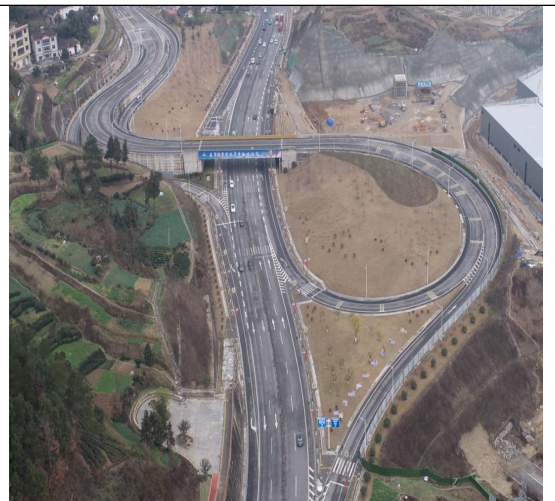
芝茅路互通景观绿化 2023 年 4 季度