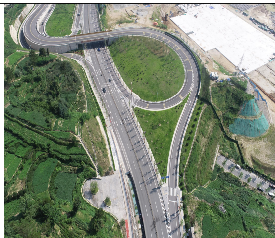
芝茅路互通景观绿化 2023 年 2 季度