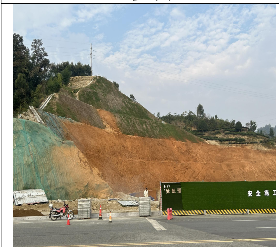
临时苫盖 (2023 年 3 季度)