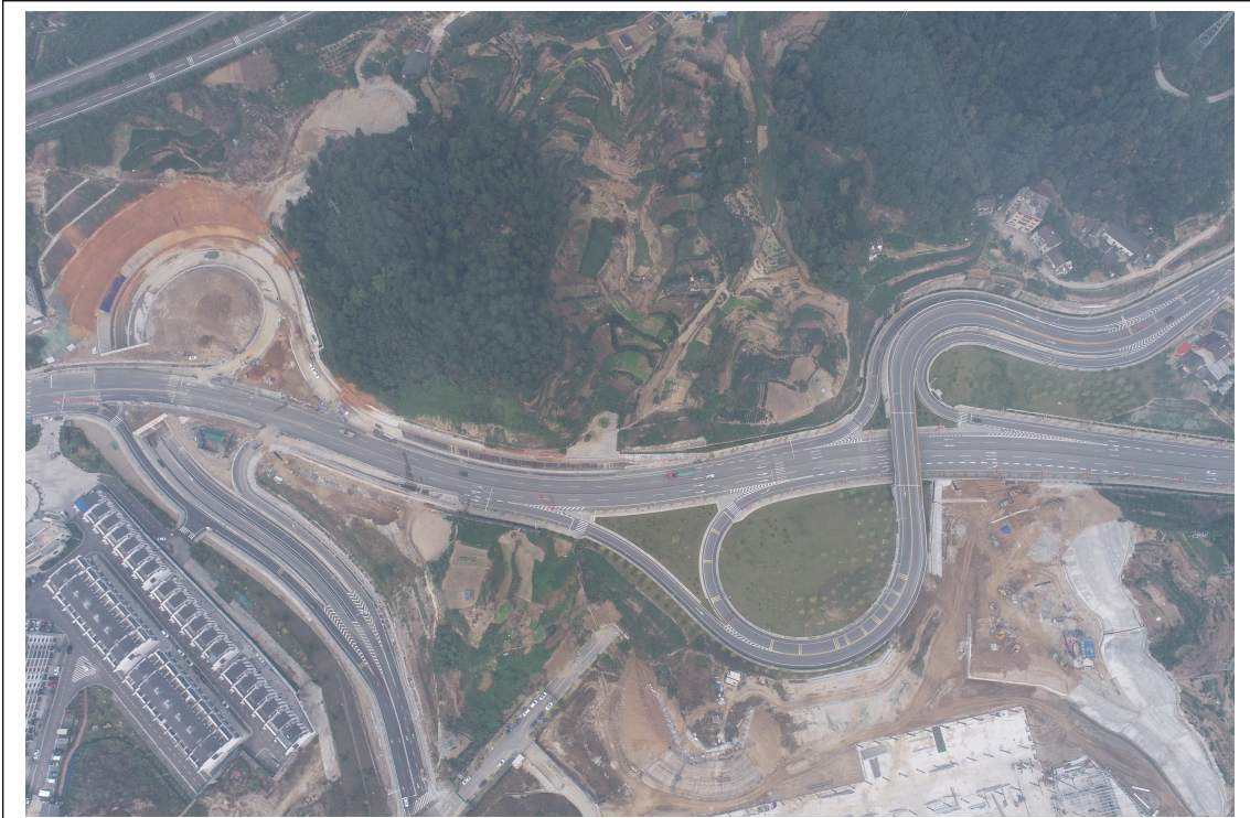
工程形象进度（2023年3季度）