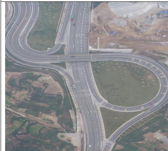
芝茅路互通景观绿化 2023 年 3 季度