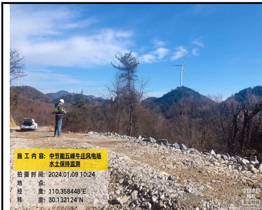
中节能五峰牛庄风电场二期工程项目开展现场监测工作