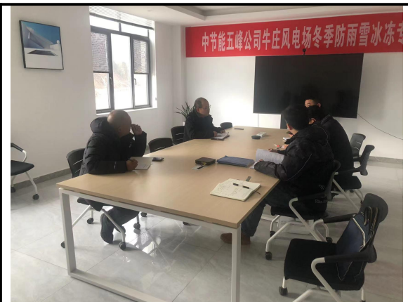
中节能五峰牛庄风电场二期工程项目水土保持图纸会审、第一次工地会议